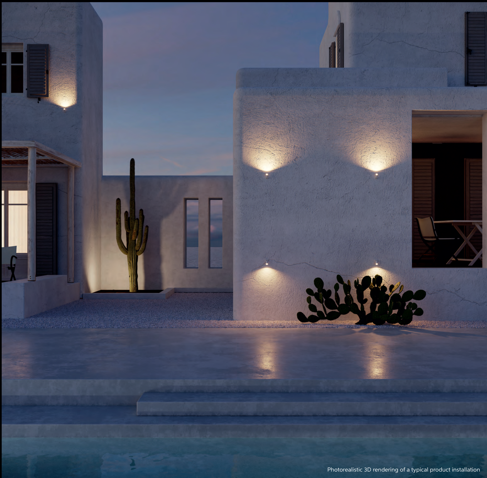
Photorealistic 3D rendering of a typical product installation